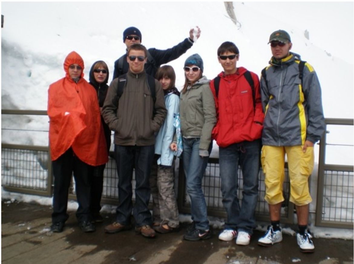
Alpy: Aquille du Midi 3842m npm (2008)