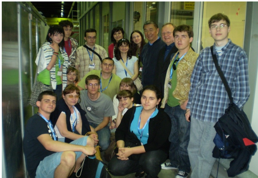
Z noblistą Samuelem Tingiem, który odkrył mezon zwany powabnym (z ang. charm) (2009)