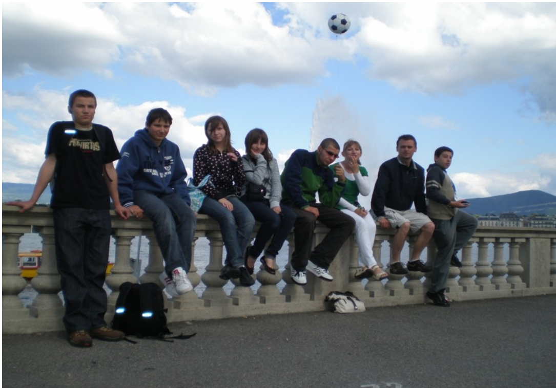
Fontanna na Jeziorze Genewskim i my :) (2008)