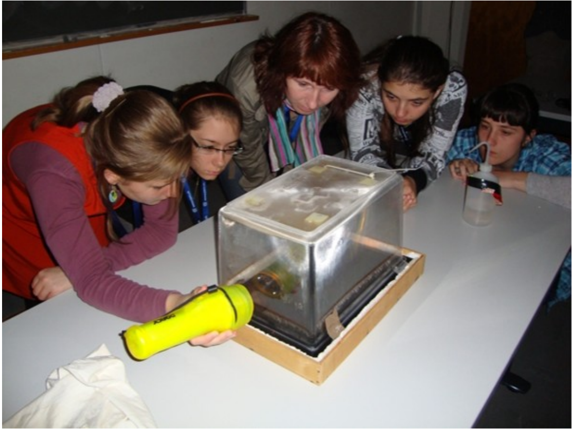
Komora mgłowa (2010)