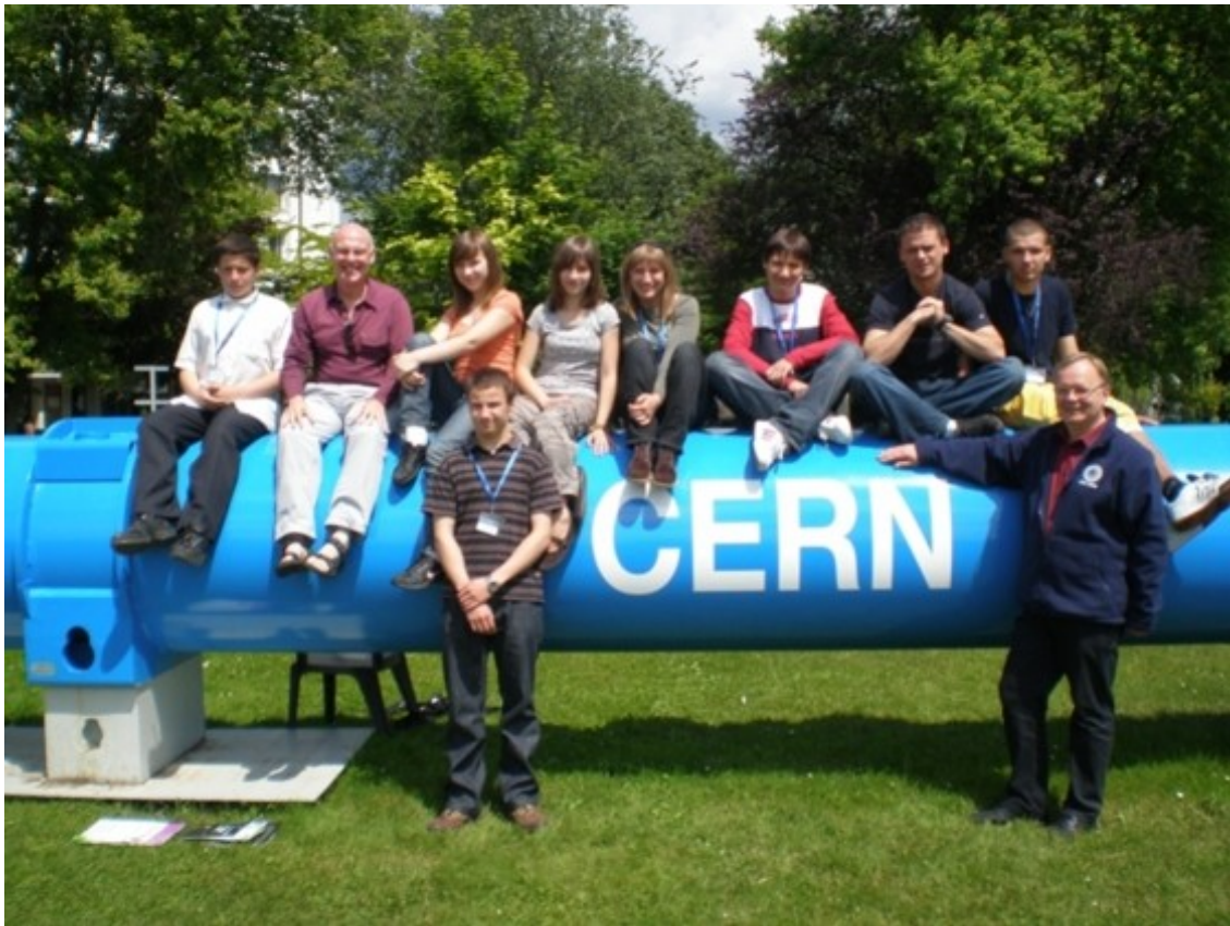
W ogrodzie CERN, na terenie laboratorium (2008)